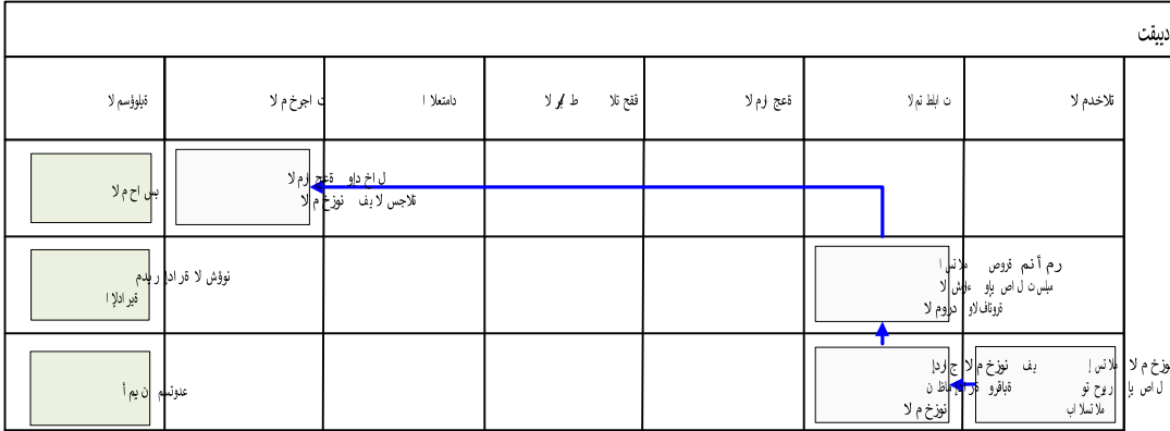
شكل رقم / ٦

يوضح المخطط البياني التالي ( شكل رقم / ٦ ) طريقة تسلسل العمل لتقييد مشتريات المخزون: